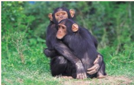
scimpanzè (m inv)