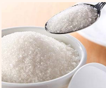
lo z ucchero