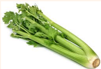
il se dano