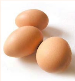
l'uovo (le uova)