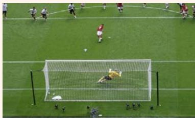
calcio di rigore