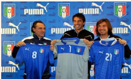
azzurri (m pl)