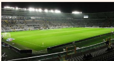
campo di calcio