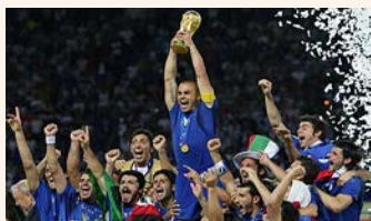
campione del mondo