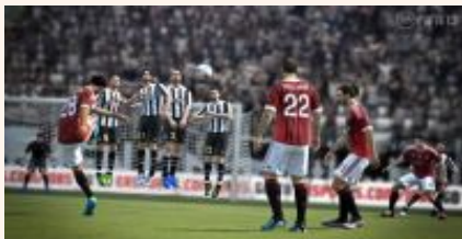
calcio di punizione